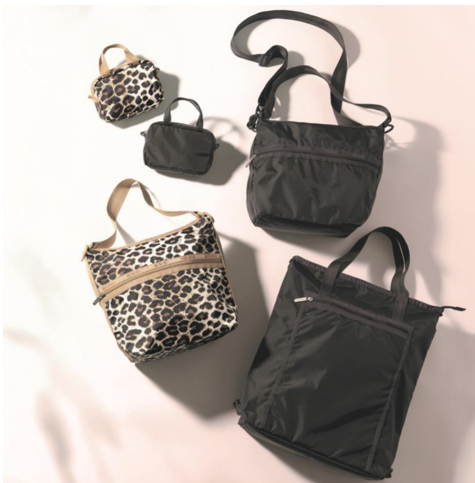
左上から、マイクロバッグ（2色）、バケットショルダーバッグ（2色）、エブリディTHバックパック（1色）