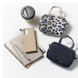
<右上 : フラクセンレオパード / 右下 : ディープシーブルー>