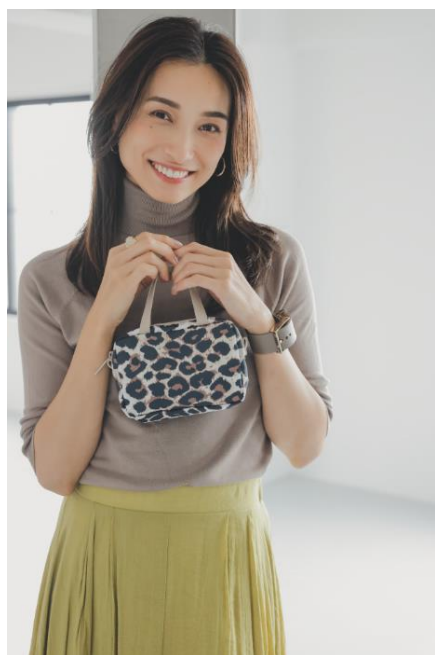
<フラクセンレオパード>

ポーチ使いはもちろん、バッグインバッグやミニバッグとしても使える汎用性の高いバッグ。ハンドル付きなのでちょっとした外出も様になります。メイク直し用のコスメやスマートフォンも入る余裕の収納力も魅力。